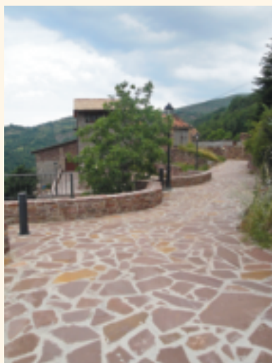
Mirador de Castell-estaó