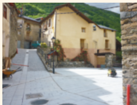
Plaça de l'església d'Espui