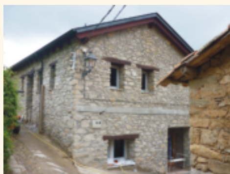
Antiga escola d'Oveix