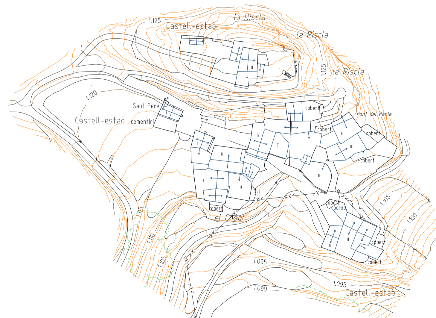
CARTOGRAFIA ANY 2.009