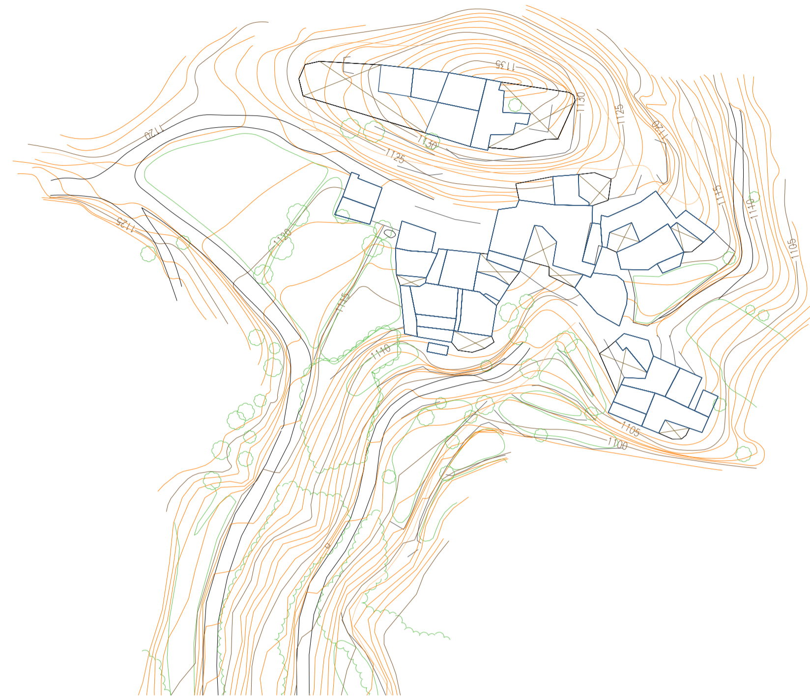
CARTOGRAFIA ANY 2.000